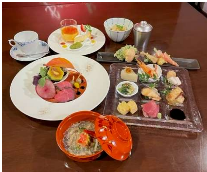
ランチコース ¥2,500-(税込)~